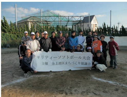
11月18日 開催 チャリティソフトボール大会