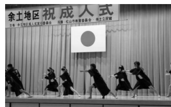
余土中 ソーラン隊の演舞