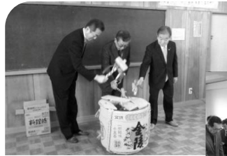
鏡開き と 会場風景