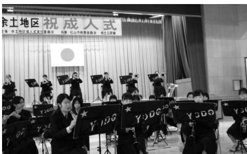
余土中吹奏楽部の演奏