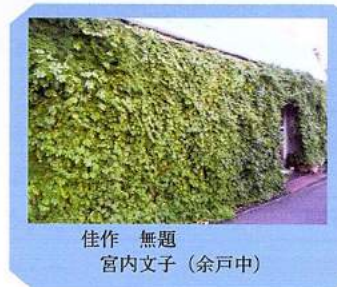
佳作 無題 宮内文子（余戸中）