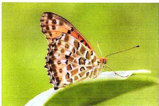
ツマグロヒョウモン